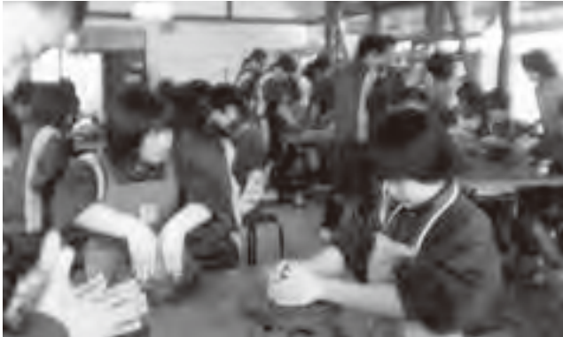
七ッ森陶芸体験館