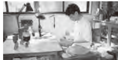
創作こけしの制作