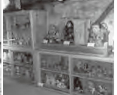
佐大ギャラリーの展示品