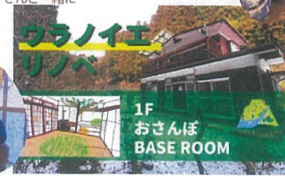
1F おさんぽ BASE ROOM