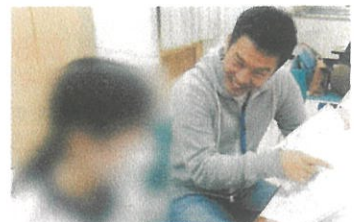
▲部活の話をする中学生に対して、筋肉について熱弁する筋肉先生！

経済的な問題や不登校など生きづらさを抱える子どもたちを対象に、学習支援やフリースペースを通じた居場所づくりを行っています。幅広い世代の方にボランティアスタッフとして活動していただき、子どもたちにとって気軽に話ができる、悩みが相談できる、安心できる場を届けています。