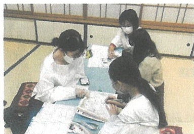
▲子ども達にとって、ボランティアは様々な相談ができる頼もしい先輩です。

学習支援カフェを開催しています。主に小・中・高校生の居場所として勉強のサポートや、食事の提供を行っています。ボランティアとして、多くの学生さんが活動しています。