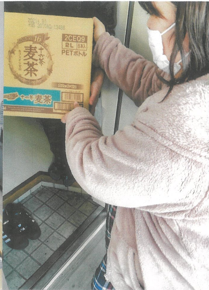
大学生への食料支援