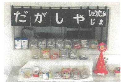
▲施設内にだがり屋コーナーを作り、利用している子ども達が買い物を楽しんでいます。

心身に障害のある小学生を対象にした放課後等デイサービスです。音楽療法等も行っており、日々の活動や遊びを見守るボランティアを募集しています。