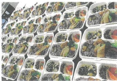
▲現在は、集まって食事をする代わりに配食や食材の配布を行っています

毎週金曜日に子ども食堂を開催しています。ボランティアに参加している方からは「自分の活動が、誰かの役に立っていることが嬉しい」という声が上がっています。継続的に活動できるボランティアを募集しています。