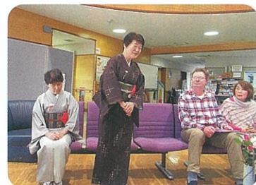
▲ポール・ナッシュご夫妻とのワークショップの様子