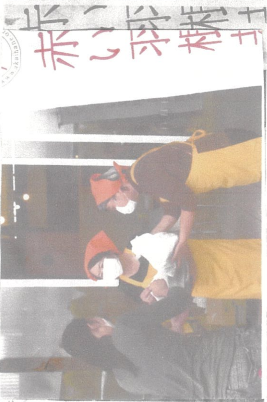
弁当と食材を買い取り、コロナ禍で日常生活に困難を抱える家庭などに提供した

同会は昨年1月、赤羽根に子どもが1人、シイタケの会員19人、一緒に食事をとる交流の場で結成。同センターを1場を作ってきたが、コ