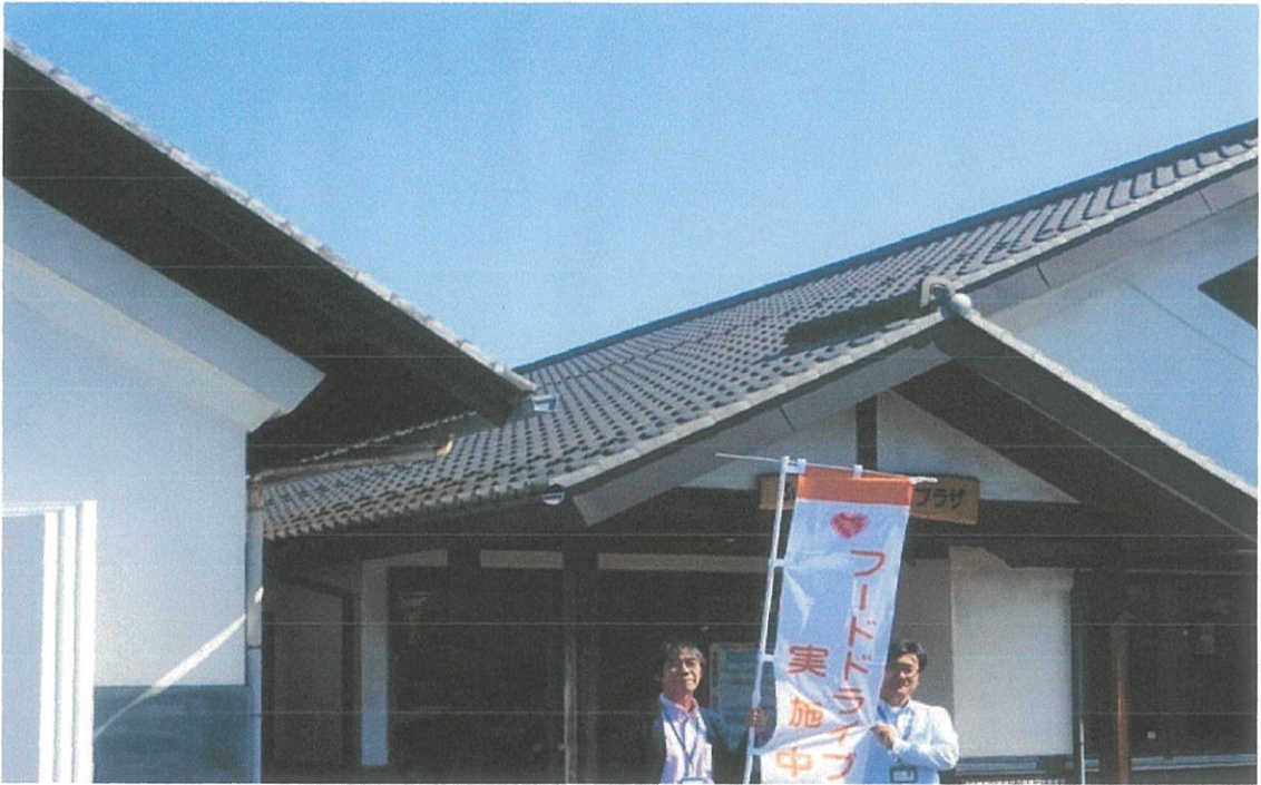
東松島市市民活動プラザ「蔵しっくぱーく」