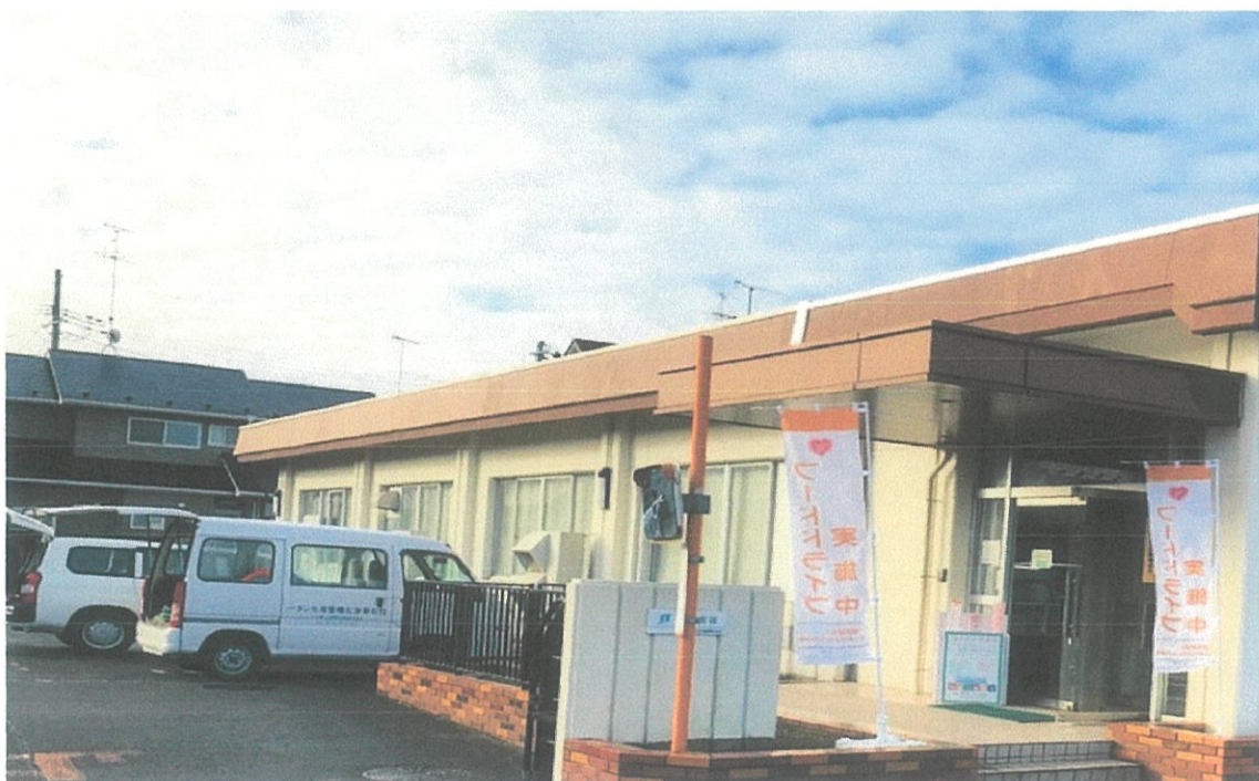
石巻市 日本たばこ産業株式会社で実施