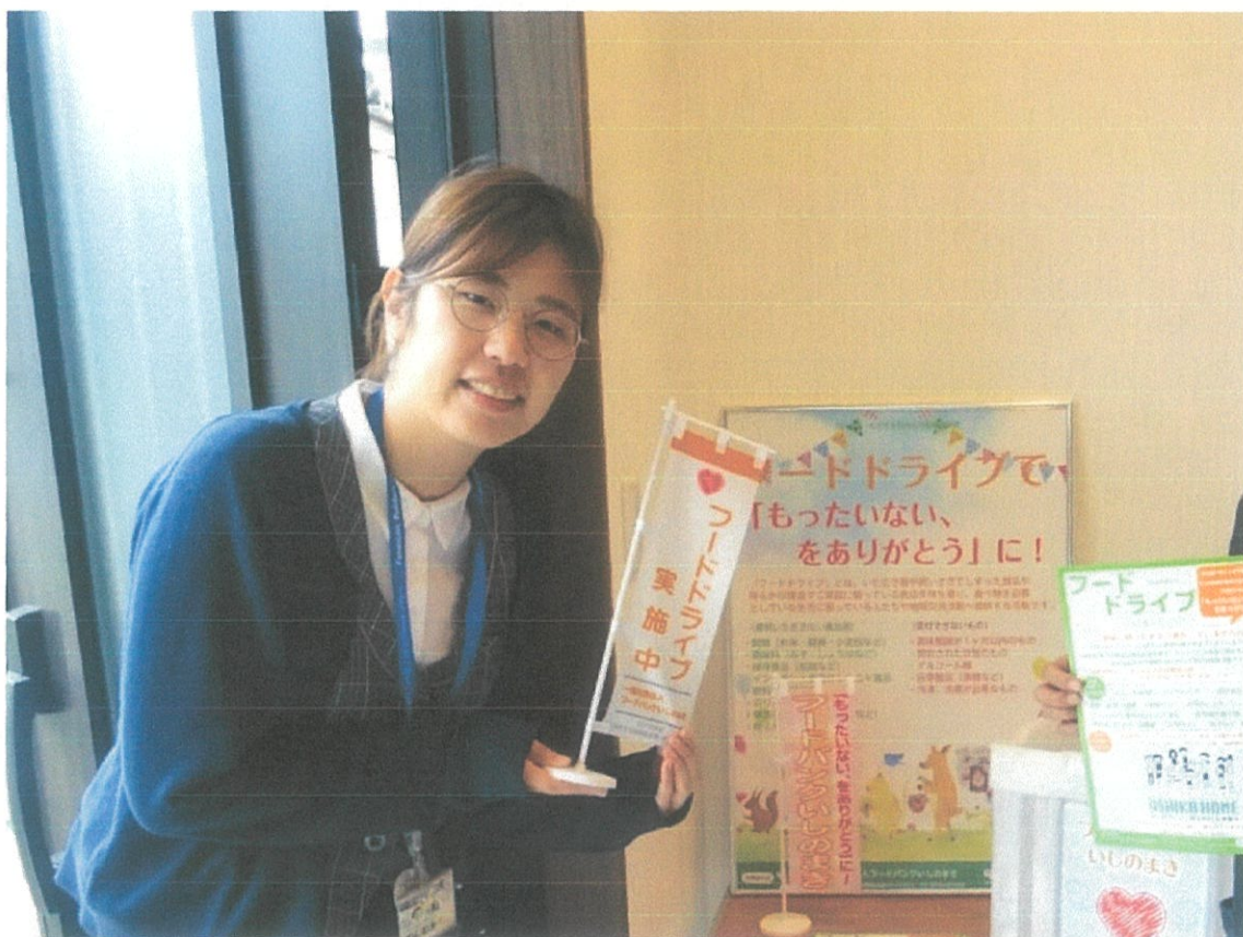
石巻市 株式会社牡鹿観光内設置