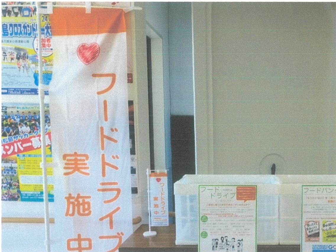
「蔵しっくぱーく」内フードドライブ設置