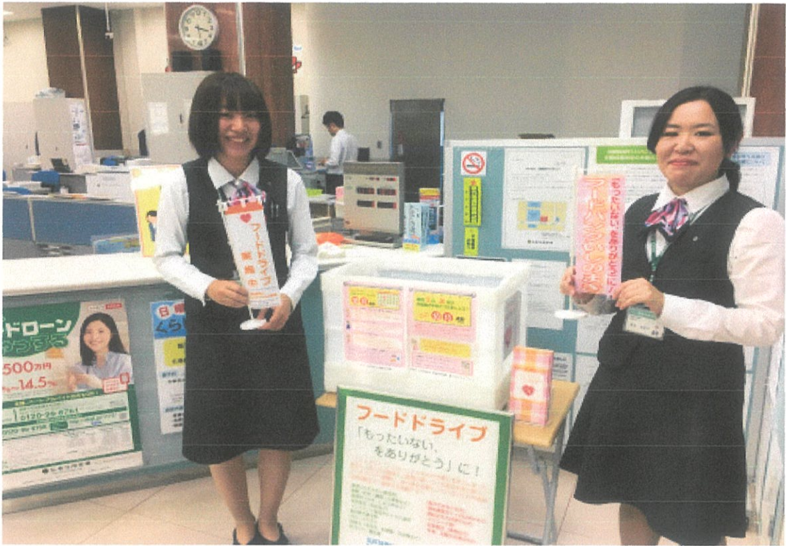
石巻市 石巻信用金庫