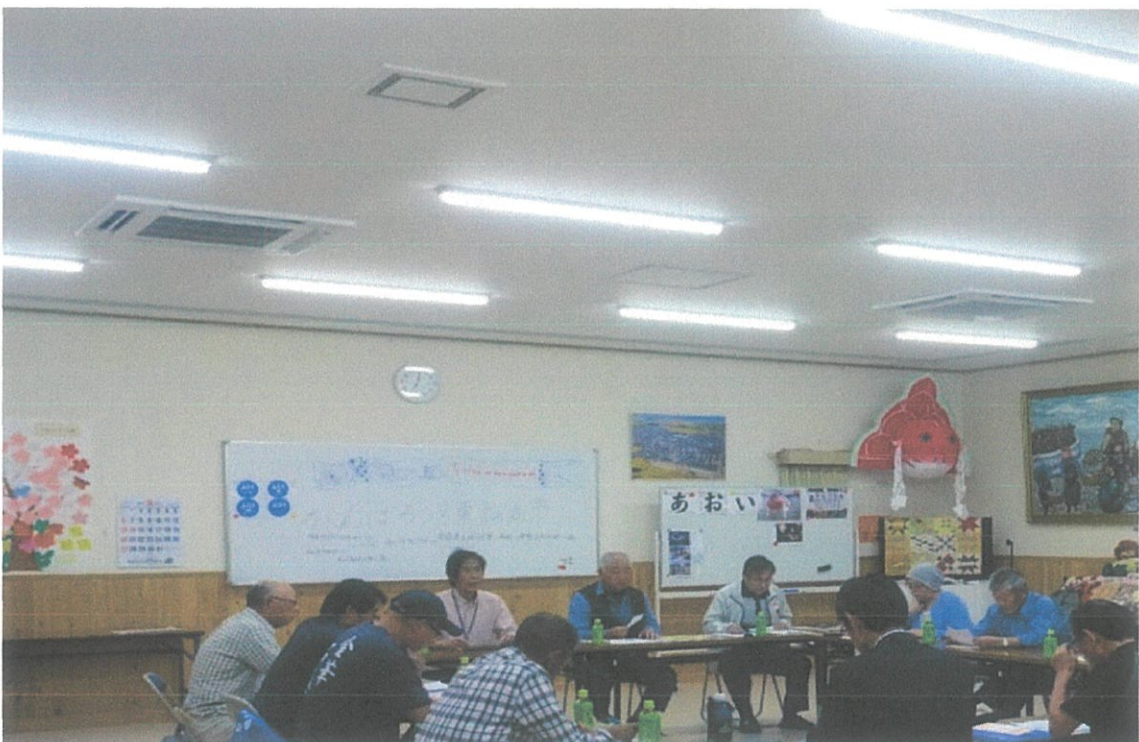
東松島市 あおい地区自治会での勉強会開催