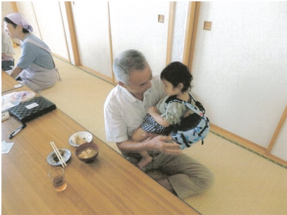
お母さんと一緒に参加してくれたお子さんとスタッフ

Narita マルシェ ウェブページ ( https://naritamarchaiswebsite.tumblr.com/ ) より抜粋