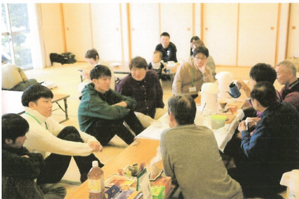
東北学院大学の学生さんが実習で参加、スタッフとコーヒーを囲んで