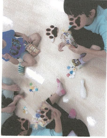
8月 子供たちの様子