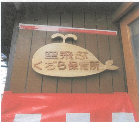
杉の木で作った看板 入ってすぐの縁台わきの壁に設置

看板の除幕式から始まりました。午前～午後とご都合のよい時間に自由に来ていただくスタイルで、72名の来場者でした。