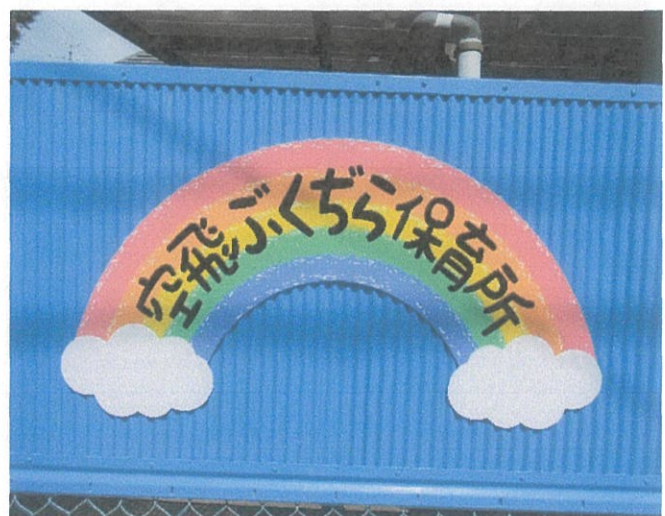
経年劣化したフェンスを青ペンキで塗って、 雨にも負けない看板を設置